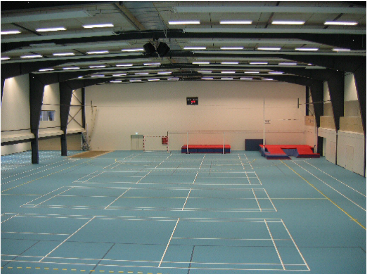
Den smukke Snekkerstenhal

Det første af vinterens store indendørs atletikstævner er traditionen tro Helsingør Atletiks Kronborg Games 1. runde, som er henlagt til en af de få atletikhaller vi har i regionen, nemlig Snekkerstenhallen ( se billede ).